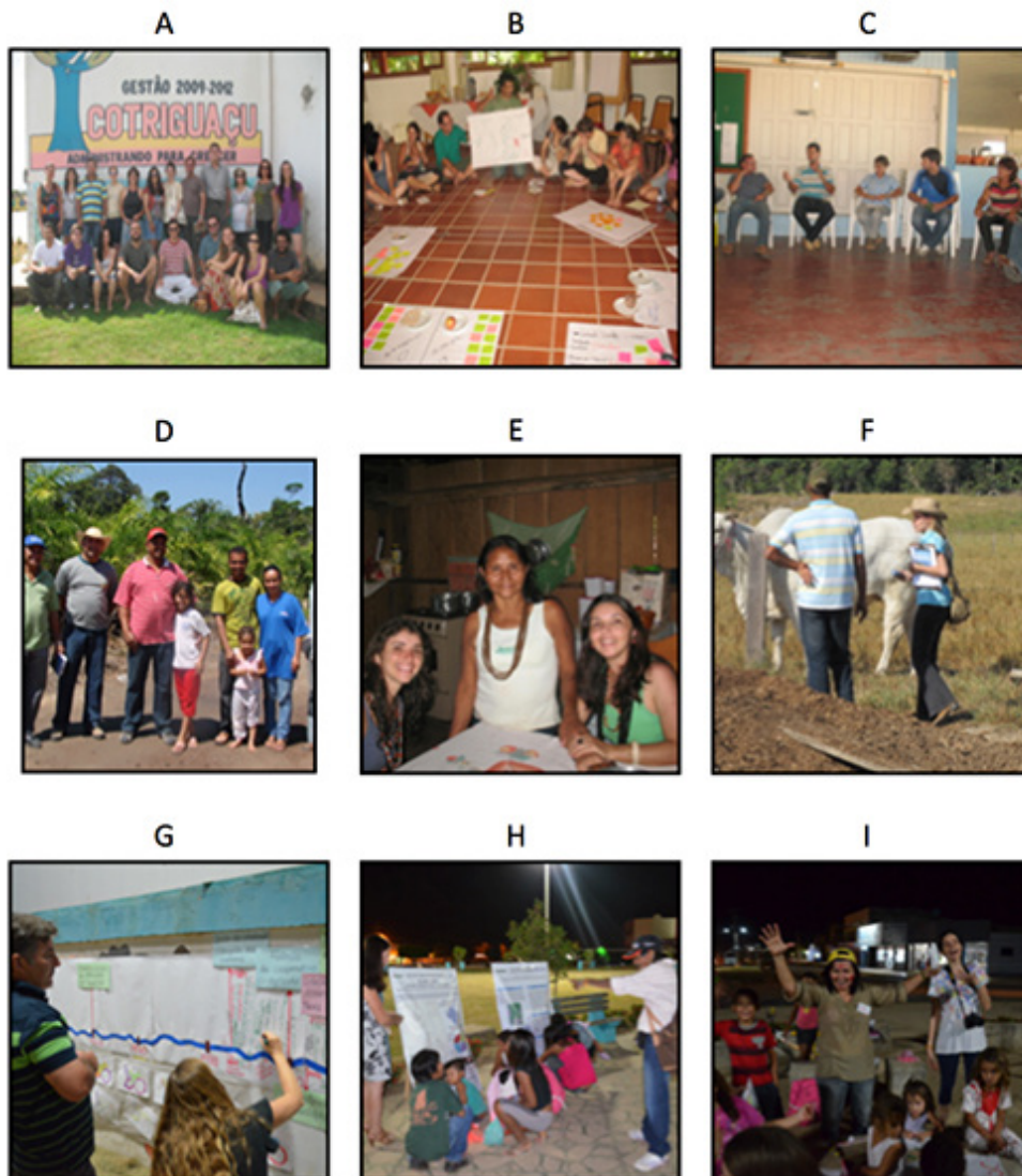
Figura 2 - Momentos de destaque do curso. A. Grupo do curso na praça municipal de Cotriguaçu. B. Ferramenta café Paulo Freire, utilizada para trabalhar temas geradores a partir da vivência dos participantes. C. Roda de conversa com gestores municipais. D-F. Interação com atores locais da agricultura familiar, povo indígena Rikbaktsa e produção pecuária. G-I. Evento de devolutiva realizado na Praça Municipal de Cotriguaçu. G. Linha do tempo interativa construída com moradores. H. Participação de representantes de comunidades Rikbaktsa. I. Atividades lúdicas realizadas com as crianças de Cotriguaçu.

Em julho de 2012, com apoio de moradores e da prefeitura municipal de Cotriguaçu, o grupo de participantes do curso organizou um evento de restituição dos resultados e produtos do curso na Praça Municipal de Cotriguaçu. O evento mobilizou muitos dos residentes do município para interagir com os participantes, o que lhes permitiu conhecer a abordagem, as atividades, e os resultados atingidos nos dois anos de realização desta iniciativa (Figura 2).